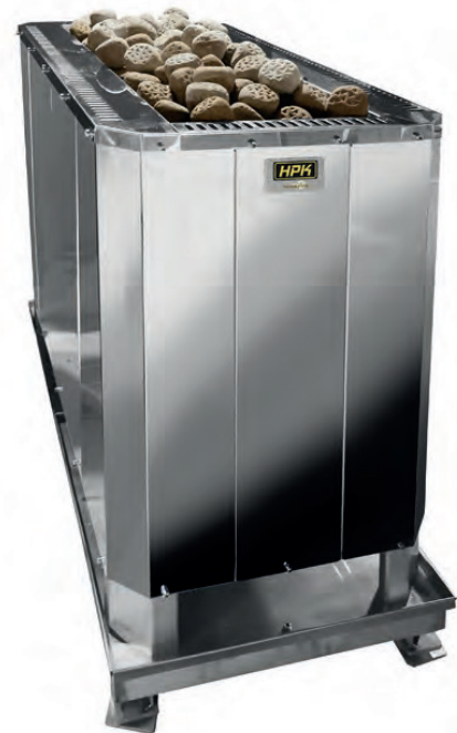
HPK/HST Saunapiste. -laitossähkökiuas HPK/HST-alustalla