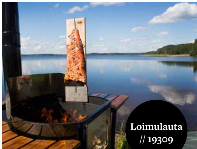
Loimulauta // 19309